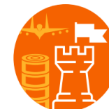
Krisberedskap och totalförsvarsplanering