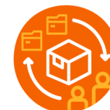
Samverkan, externa aktörer och resurser