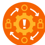
Ledning och styrning i fredstida kriser och höjd beredskap