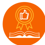
Utbildning och övning