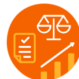
Ekonomi, juridik och upphandling