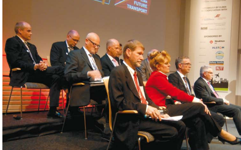
En av mässtdagarna är vigd åt huvudkonferensen med ett högaktuellt ämne i fokus. På plats finns intressanta föreläsare, politiker och företagsledare.

Informella möten är nog så viktiga. Under en av mässkvällarna dukas en stor buffé upp, som avnjuts med bra underhållning och trevligt sällskap. Festen är mycket populär och blir snabbt fullbokad. Därför ger vi dig som utställare förtur till att boka biljetter.