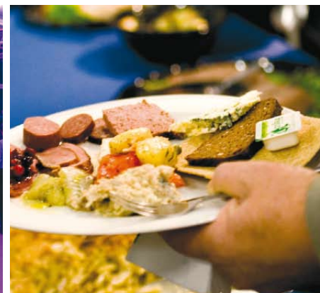
Den stora festen under en av mässans kvällar är mycket uppskattad och lockar mycket folk.